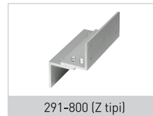
291-800 (Z tipi)