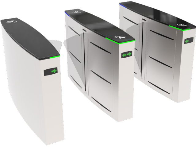
Opsiyonel kayar asteroid indikatörü üst kapak